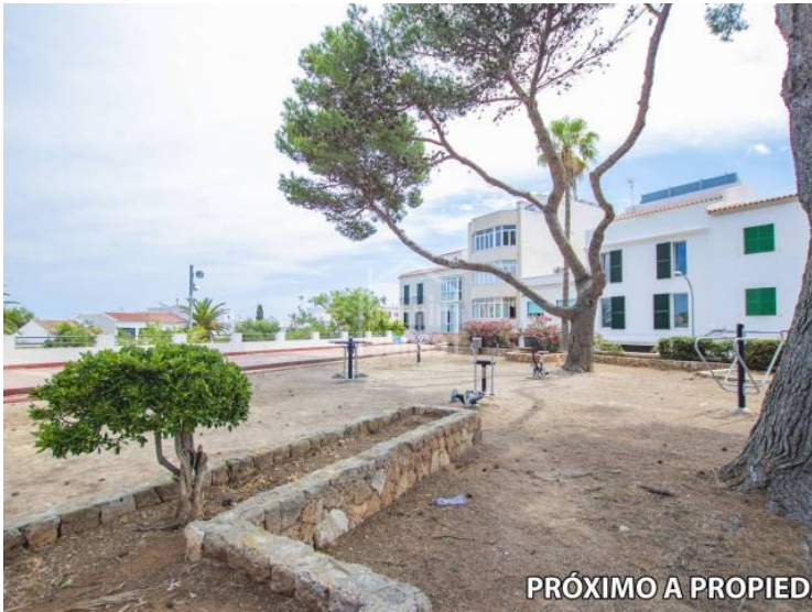
PRÓXIMO A PROPIED