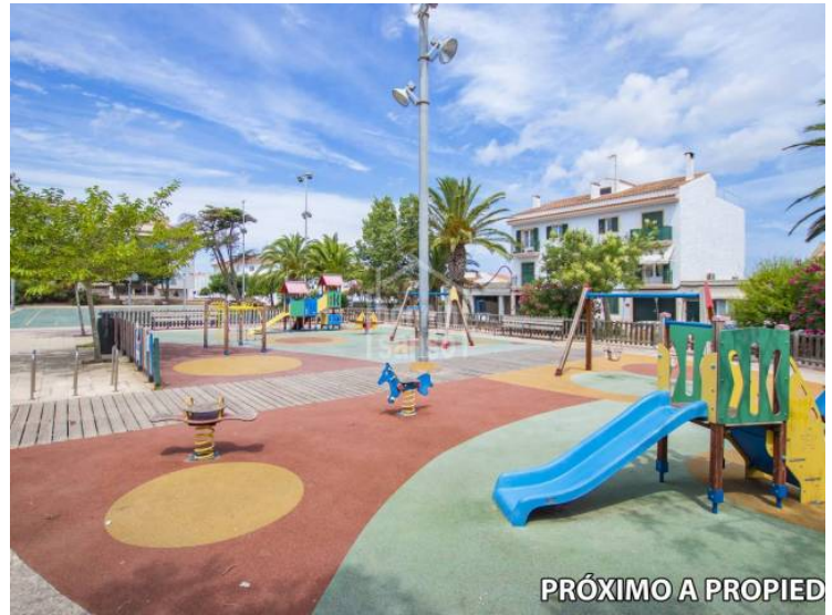
PRÓXIMO A PROPIED