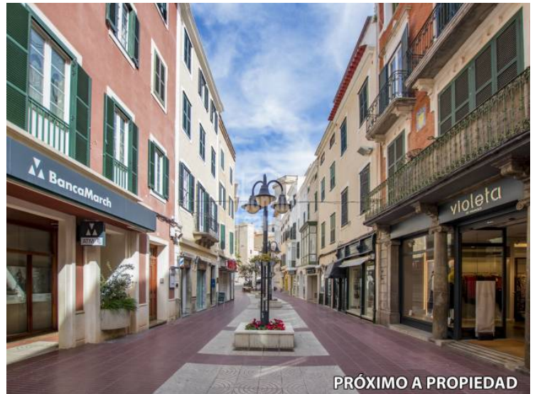
PRÓXIMO A PROPIEDAD