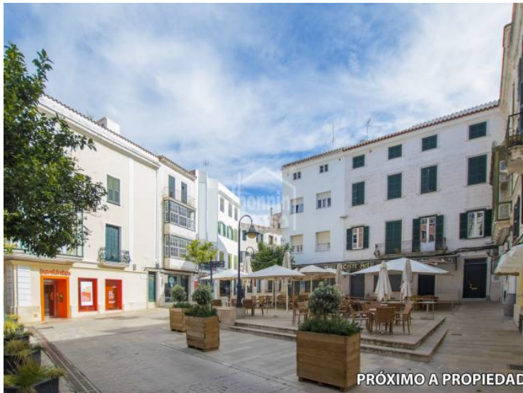
PRÓXIMO A PROPIEDAD