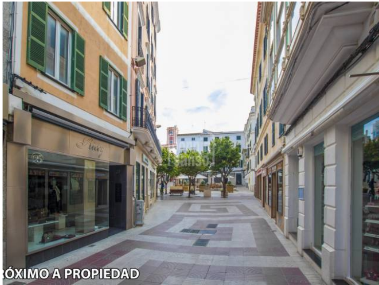
PRÓXIMO A PROPIEDAD