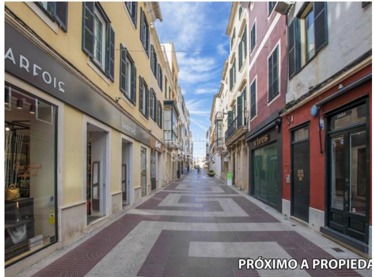
PRÓXIMO A PROPIEDAD