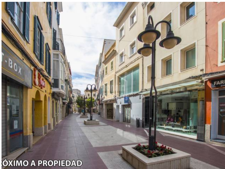
PRÓXIMO A PROPIEDAD