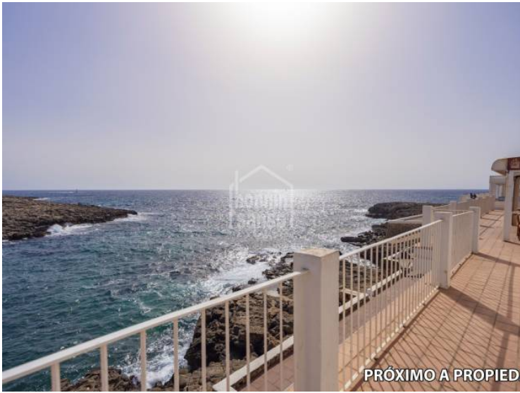
PRÓXIMO A PROPIEDAD