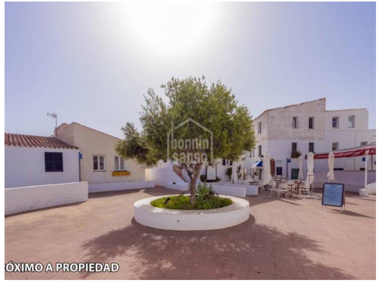
PRÓXIMO A PROPIEDAD