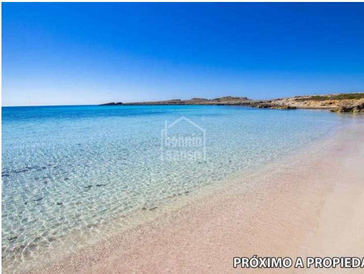
PRÓXIMO A PROPIEDAD