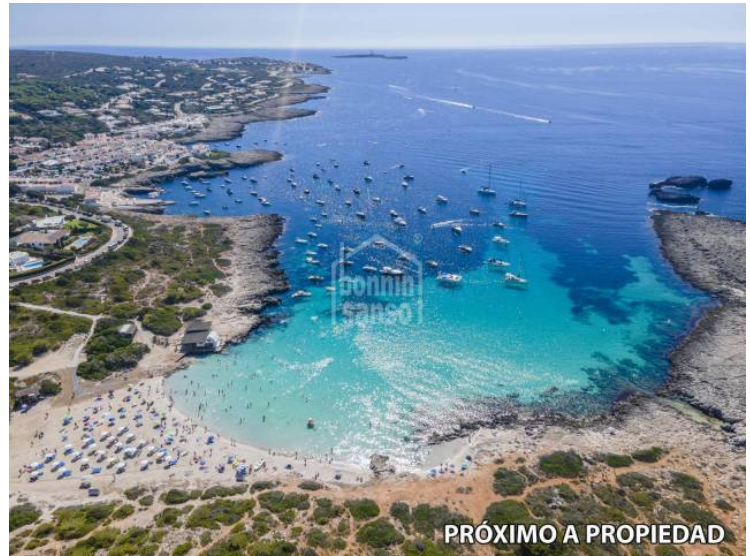
PRÓXIMO A PROPIEDAD